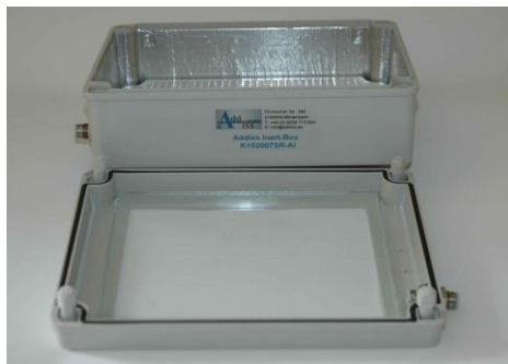
IB-K152007SR-AI geöffnete Inert-Box