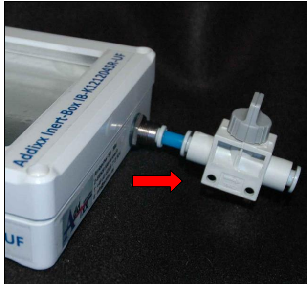
IB-K121204SR-UF Gaseinlass / Gasauslass