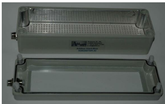
IB-K082507SR-AI geöffnete Inert-Box