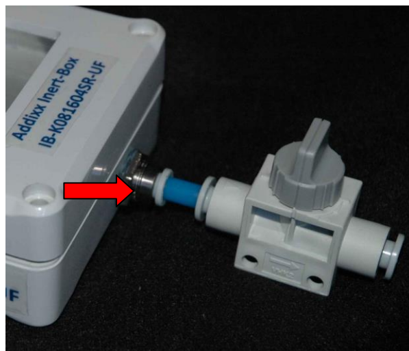
IB-K081604SR-UF Gaseinlass / Gasauslass mit Ventil