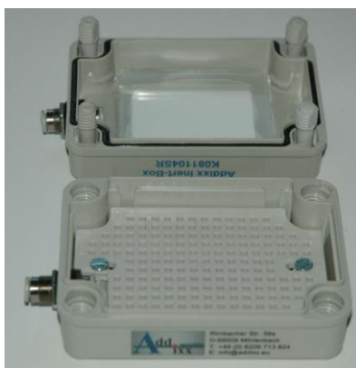
IB-K081104SR geöffnete Inert-Box